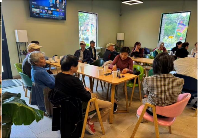
(爱心发廊义工黄海毅供稿)