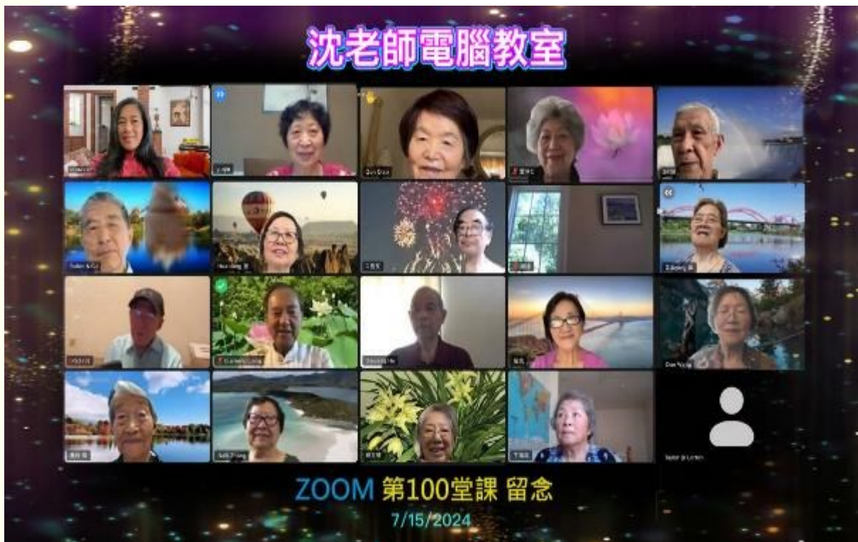
沈老师电脑教室的部分学员与沈老师（一排左一）Zoom 照片