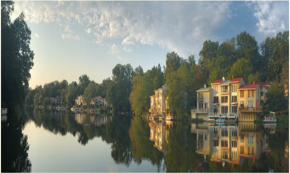
安妮湖全景