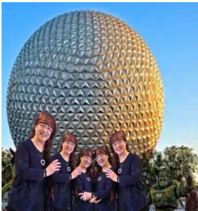
一个变五个（分身术，姿势不同）

影像、美颜相机、抠图、拼贴、照片的还原和打字，特别是分身术，移花接木，滤镜等功能，引起了学员们的极大兴趣。葫芦老师用分身术，把自己一个人变成五个人、十二个人形态和姿势各异。就是孙悟空见到也会惊艳的。