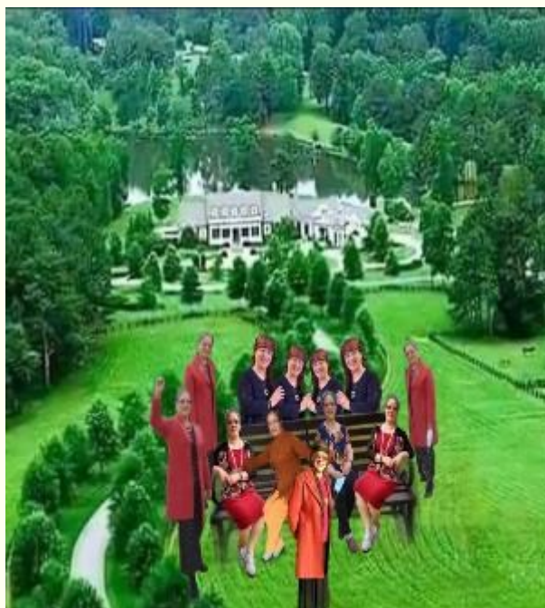
一人变十二个（服饰、姿态不同）