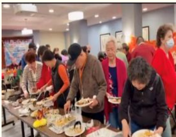
居民们有序的拿取美食享用。

除了美食之外，感恩节的装饰也是一大亮点。社会厅内的装饰充满了节日的气氛，五彩的纸花、火鸡和各式各样的装饰品，精心布置的感恩节餐桌，将整个活动场所装点得如诗如画，让居民们感受节日的浓厚氛围。活动在一片欢乐和温馨中接近尾声，居民们依依不舍地回到各自的房间。这次的感恩节活动，让老人们在感恩和欢乐中度过了一个美好的节日，也为他们的生活增添了一抹亮色。