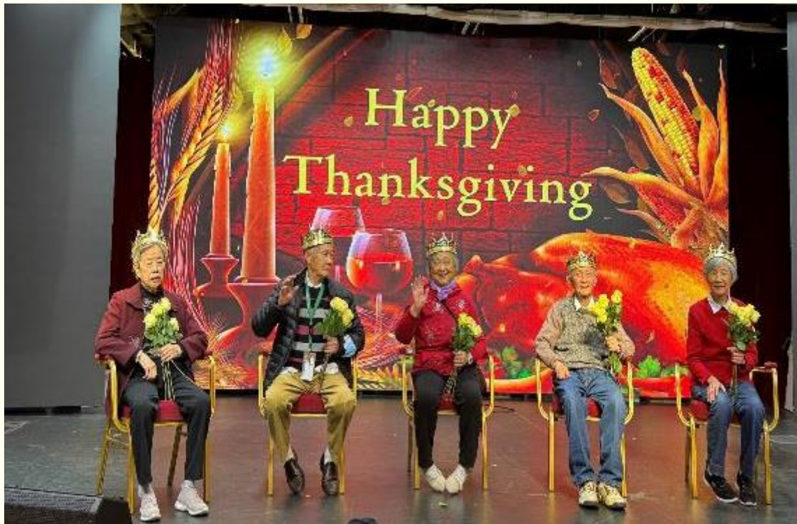
为当月生日的老寿星祝寿

午餐后老人们还要玩一会 bingo。这遍及西方的游戏，是专为老人们饭后安静一会安排的。同时也是一次全体集合。玩了大半天了，到回家的时候了，老人们还有些依依不舍……。